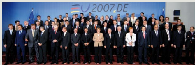
• Les chefs d'État européens réunis lors du sommet européen de Bruxelles, le 22 juin dernier.

• ec.europa.eu/commission_barroso/borg/index_fr.htm